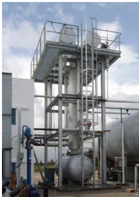
CO 2 -Strippersystem für hochreines CO 2