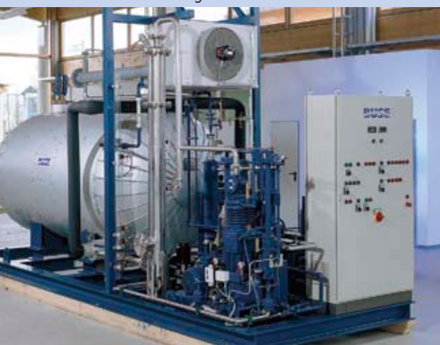
Kompakte CO 2 -Rückgewinnungsanlage für 30 kg/h