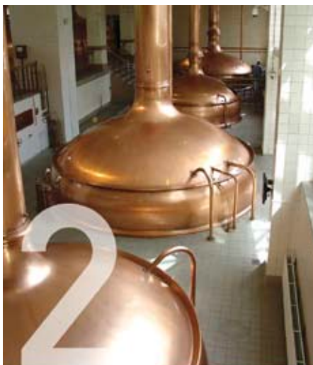
CO 2 - RÜCKGEWINNUNGSANLAGEN FÜR BRAUEREIEN