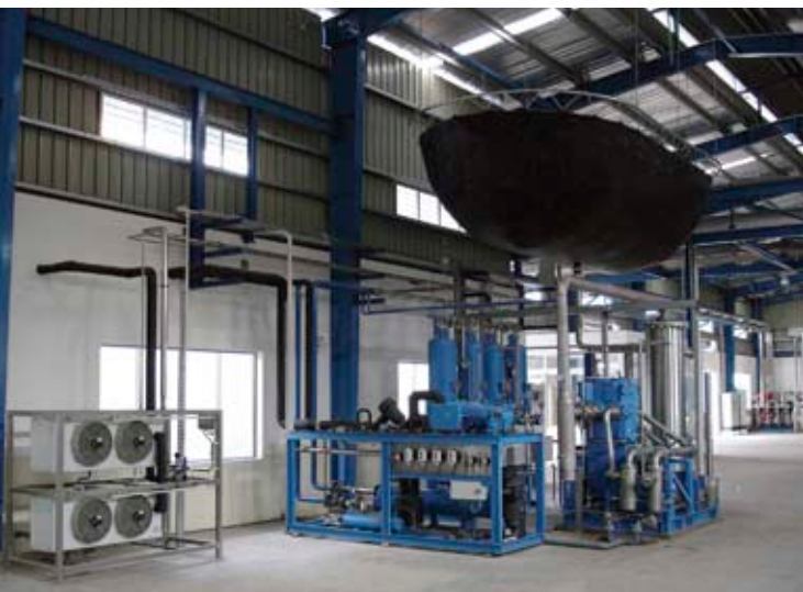
Standard CO 2 -Rückgewinnungsanlage “System BUSE RGW-BRAU 0500”

Gasförmiges CO 2 entsteht bei der alkoholischen Gärung von Zucker durch Hefen in Gärtanks. Das aufbereitete CO 2 -Gas wird in verschiedenen Bereichen der Brauerei eingesetzt, z.B.