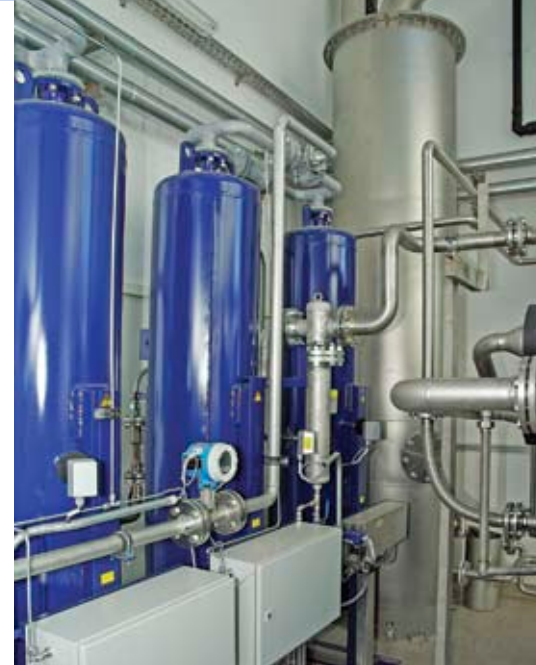
Kombinierte Reinigungs- und Trocknungsanlage für CO 2 (links) Edelstahl-Rohgaswäscher (rechts)

Das getrocknete und gereinigte CO 2 -Gas wird in der CO 2 -Verflüssigungsanlage auf unter -25°C gekühlt und dabei verflüssigt. Zur weiteren Erhöhung der CO 2 -Reinheit und Rest-O 2 -Entfernung (unter 5 vpm) im Flüssig-CO 2 kann optional ein Strippersystem dem CO 2 -Verflüssiger nachgeschaltet werden. Das flüssige und lebensmittelreine CO 2 wird schließlich in einem isolierten CO 2 -Lagertank gespeichert.