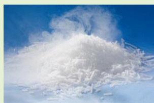
Pellets, diamètre 3 mm (destinées à la projection de glace carbonique)