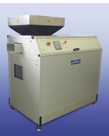
Reformeur de glace carbonique BJU-S