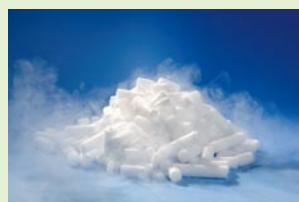
Pellets Diamètre 10 mm