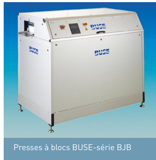
Presses à blocs BUSE-série BJB