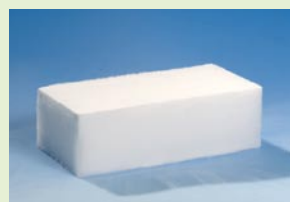
Bloc standard (Épaisseur variable)