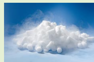
Nuggets Diamètre 16 mm